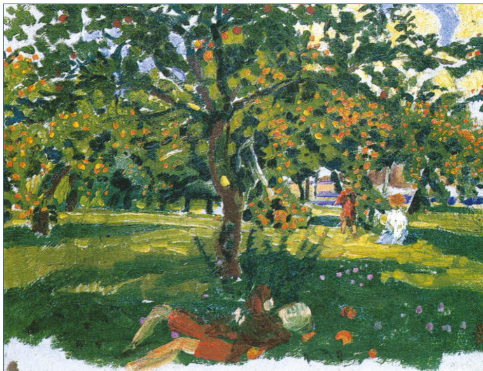
Maurice Denis, L'Enfant couché sous le pommier (1903)